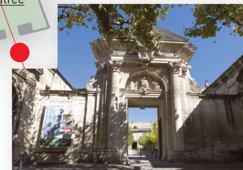
La Chartreuse | 58 rue de la République | 30400 Villeneuve lez Avignon